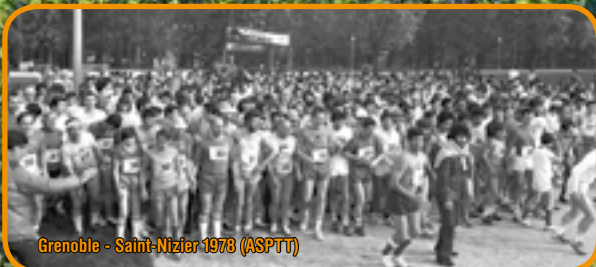
Grenoble - Saint-Nizier 1978 (ASPTT)

Contactez-nous par mail au letraildes3pucelles@gmail.com ou directement par téléphone au 06 73 48 11 33.