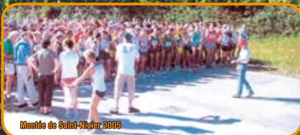
Montée de Saint-Nizier 2005